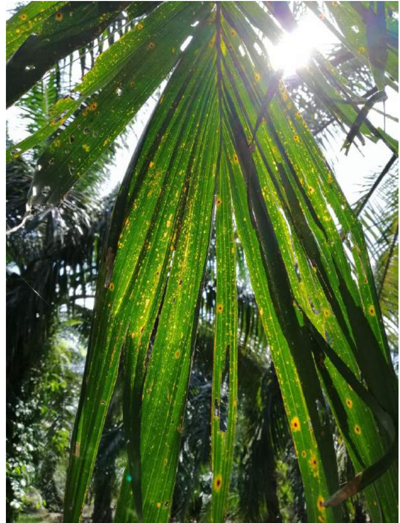
Simptom bintik kuning/ oren