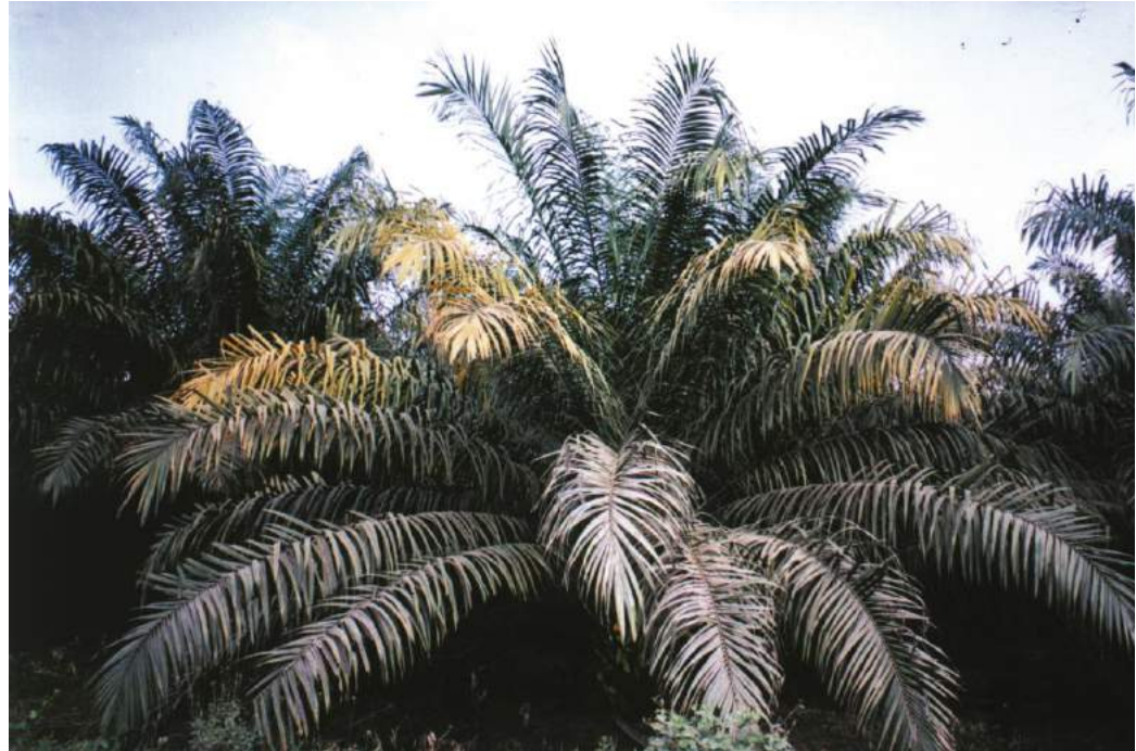
Simptom klorosis/ kekuningan tengah kanopi ('mid-crown chlorosis')