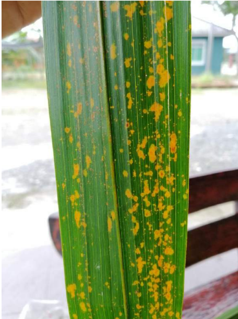
Pandangan dekat simptom bintik kuning/ oren